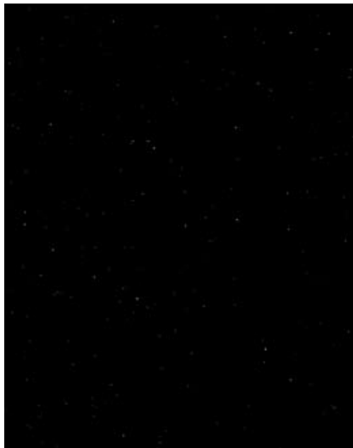
Fotografía de la constelación de Hércules.

el centro de la constelación y que marca la pelvis del gigante. A partir de zeta ( \zeta ), hacia el sur, nos topamos con beta ( \beta ), gamma ( \gamma ) y kappa ( \kappa ), que marcan el brazo derecho. Ras Algethi, la alfa de la constelación, simboliza la cabeza de Hércules. De hecho, Ras Algethi significa “cabeza del arrodillado.” Si ahora partimos de épsilon ( \epsilon ) hacia el sureste hasta alcanzar la \delta (delta) y luego prolongamos hacia el este pasando por lambda ( \lambda ), mu ( \mu ) Xi ( \xi ) y ómicron ( \omicron ), habremos delimitado el brazo izquierdo. La pierna izquierda arranca de pi ( \pi ), y está indicada por las luminarias rho ( \rho ), tetha ( \theta ) e iota ( \iota ), mientras que la pierna derecha corresponde a las estrellas sigma ( \sigma ), tau ( \tau ) y fi ( \phi ).